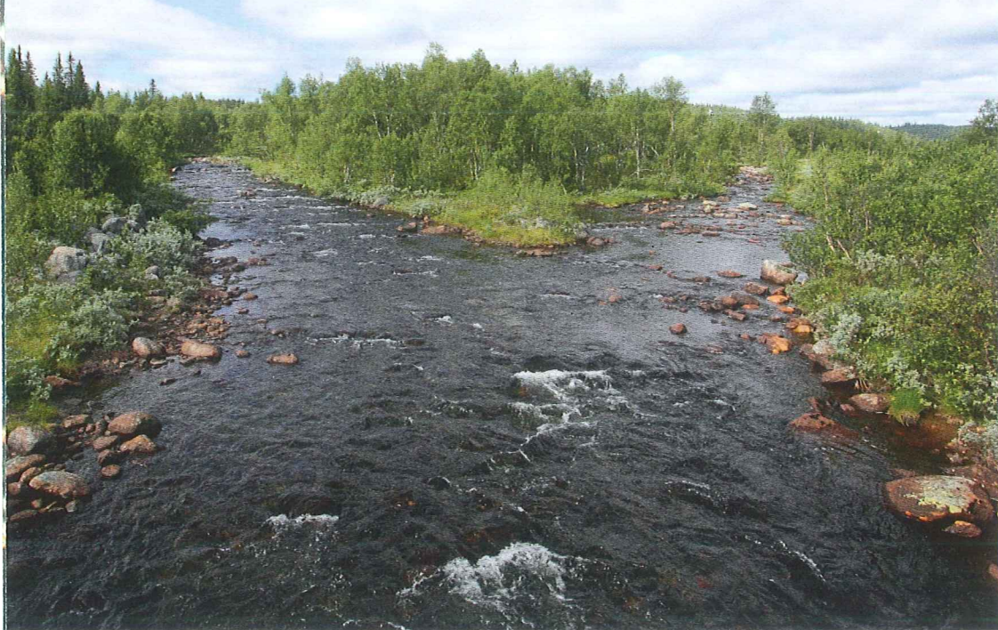
SPENNENDE ELV: I elva Lenna finnes det spennende kulper som kan huse fin fisk ved god nok vannføring.

også for Synnfjorden og nordvestre del av Dokksfløyvatnet, samt vestre breidd av Dokkelva innenfor fellesstrekningen med Gausdal.