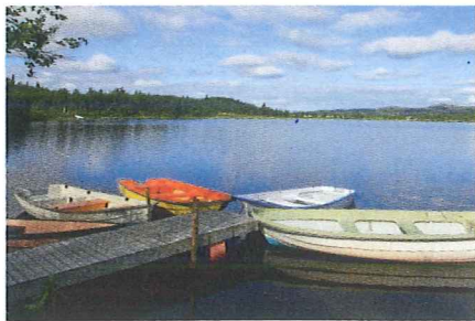
BÅTUTLEIE: Vil du ut i båt, er det mulig å leie blant annet i Sebu-Røssjøen.