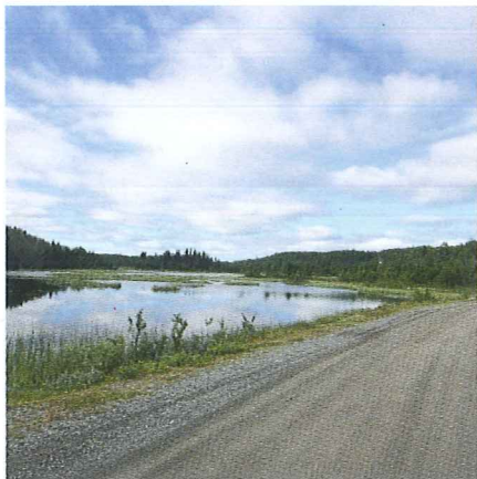
VEINÆRE VANN: Ønsker du å spare beina, er det mange lett tilgjengelige vann rett i nærheten av bilvei.

Andre gode ørretvann i allmenningen er Sæbu-Røssjøen, Røssjøkolltjernet og Storlægervatn. Følungtjerna, Tronhustjernet